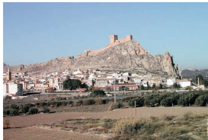
El castillo de Sax