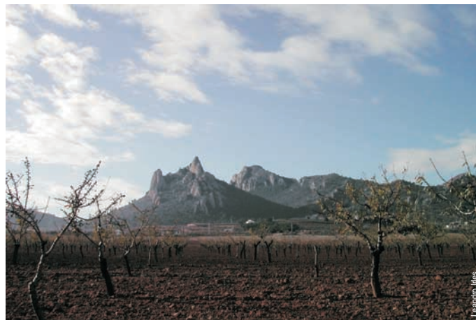
Sierra de Cabrerias, Sax