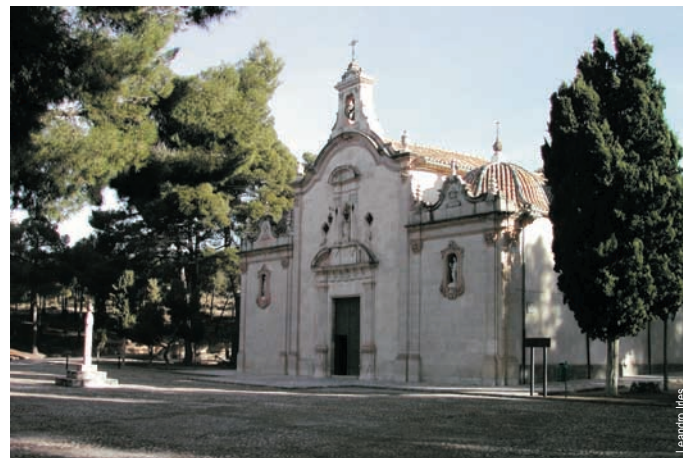
Santuario de Nuestra Señora de Gracia, Biar